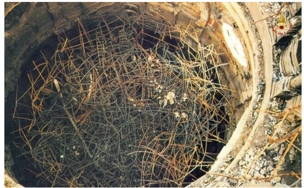
Interno della cappella al termine dell'incendio (resti del ponteggio)

Ad oggi, nonostante le numerose perizie, non si è stati in grado di stabilire le cause dell'incendio: alcuni periti erano convinti che le cause fossero colpose (cortocircuito o lampade lasciate accese dai restauratori) mentre altri, invece, ritenevano che la causa dell'incendio fosse dolosa e che quindi sia stato qualcuno ad appiccare il fuoco.