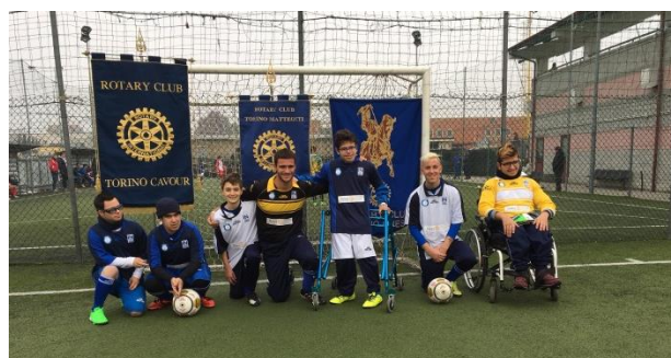
Alcuni allievi della Scuola calcio degli Insuperabili

Il gruppo Torino Ovest di cui fanno parte i R.C. Torino Ovest, San Carlo, Cavour e Matteotti quest'anno ha deciso di sostenere come progetto condiviso la squadra di calcio per atleti diversamente abili ōInsuperabiliō contribuendo, grazie anche ad un District Grant, all'acquisto delle divise degli atleti che sono state consegnate nel corso di una cerimonia svoltasi Sabato 19/11.