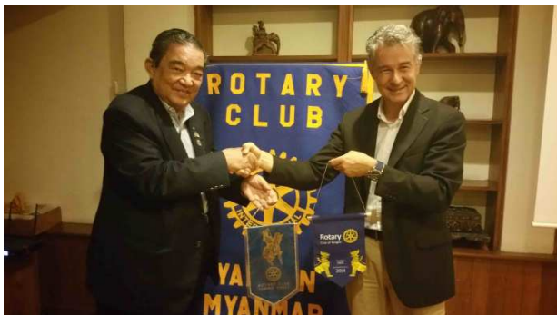
Il nostro gagliardetto è arrivato a. Yangoon (Birmania)