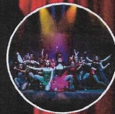
Gypsy Musical Academy